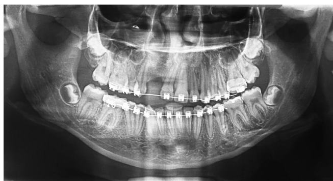
Figura 1. Radiografia panorâmica pré-operatória representativa de um dos casos de implante dentário a ser instalado em área da fissura alveolar direita, previamente reconstruída com enxerto ósseo autógeno da crista ilíaca.

Quando necessário, para melhor volume ósseo ou recobrimento de rosca expostas, adicionou-se enxerto ósseo de origem bovina, liofilizado e granulado (Figura 3). Foram realizados 03 enxertos onlay complementares na forma de bloco autógeno em um total de 02 pacientes, todos fixados com parafusos do sistema 1.5mm, e com enxerto de osso bovino liofilizado granulado complementar, da marca Bionnovation®. Nestes sítios, a média de tempo entre a