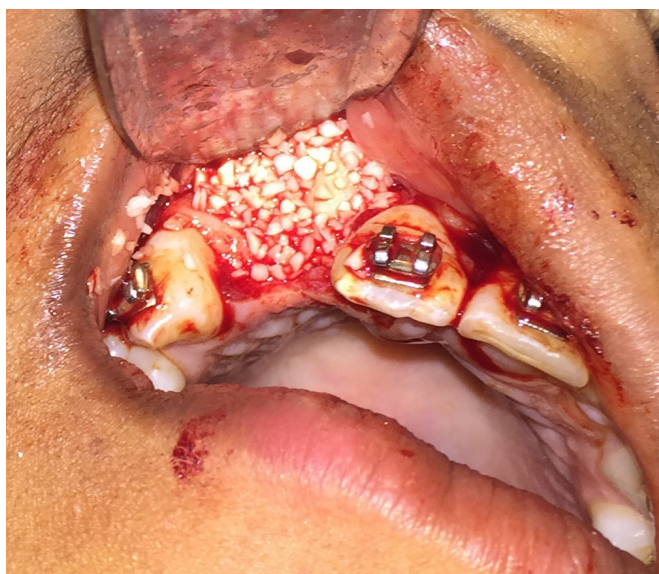
Figura 3. Enxerto de osso alveolar complementar com biomaterial. (osso bovino liofilizado granulado).

Foram observados sinais radiográficos sugestivos de neoformação óssea em 14 (93,3%) dos implantes. No entanto, o travamento secundário foi constatado em 12 (80%) do total de implantes, sendo observada mobilidade e realizada prontamente a remoção de 03 (20%) implantes, não ocorrendo mais de um insucesso no mesmo paciente. (Tabela 2).